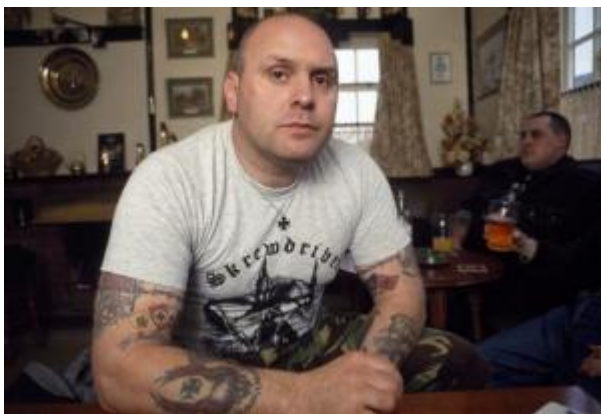
Ian Stuart Donaldson (1957-1993) var nazirockens gudfar.

Men dette bokessayet handler ikke om unggutter som bruker hakekors for å skremme mamma eller rockere som gjør rare ting i narkofylla. Det handler om musikere som er overbeviste, ideologiske nasjonalsosialister og som lager rock for å spre sine idealer.