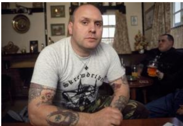
Ian Stuart Donaldson (1957-1993) var nazirockens gudfar.

Men dette bokessayet handler ikke om unggutter som bruker hakekors for å skremme mamma eller rockere som gjør rare ting i narkofylla. Det handler om musikere som er overbeviste, ideologiske nasjonalsosialister og som lager rock for å spre sine idealer.