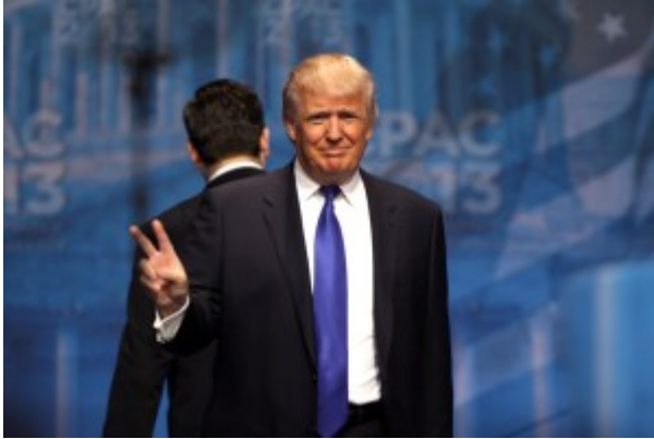
Donald Trump taler på CPAC-konferansen i 2013.

Som et ledd i sin kampanje for å diskreditere tradisjonelle, liberale aviser og tv-kanaler som stiller seg kritisk til ham, beskylder Trump og «det alternative høyres» blogger nettopp disse for å produsere «falske nyheter» - og det til tross for at det først og fremst var han selv og «det alternative høyres» blogger som gjorde «falske nyheter» til en strategi i presidentvalgkampen. Nok en gang er taktikken å beskyldte motparten for skitne knep man selv gjør bruk av, og blånekte for at man selv har gjort noe slikt.