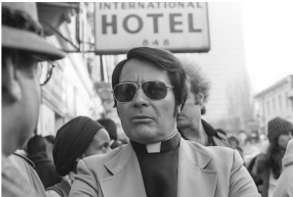
Reverend Jim Jones på en demonstrasjon i San Fransisco i januar 1977.