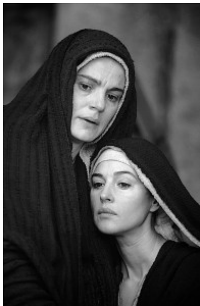
Jesu mor Maria og Maria Magdalena slik de framstår i Mel Gibsons film The Passion of the Christ.